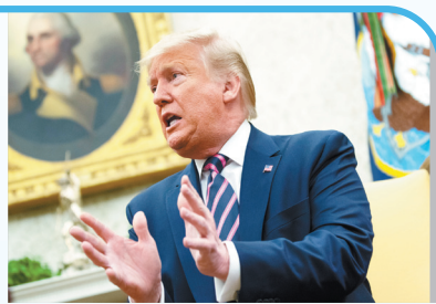
逾兩年通俄門調查結束，得出結論是特朗普沒有通俄。資料圖片

特別檢察官穆勒領導的通俄門調查在持續近兩年後結束，指未有足夠證據顯示特朗普的競選團隊通俄。但在特朗普是否妨礙司法公正問題上卻只提交有關調查證據，司法部長在交給國會領導人的報告簡報中，得出特朗普並沒有妨礙司法公正的結論。特朗普稱穆勒的報告為他昭雪，但民主黨人十分不滿，自此呼籲彈劾總統的呼聲日高。