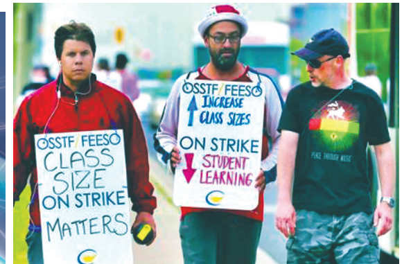
安省多個公立學校教師工會年底展開工業行動。資料圖片