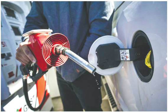
聯邦徵收碳稅，福特政府與訟失敗，仍將上訴。資料圖片