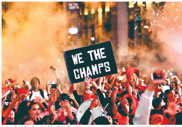
多倫多猛龍隊贏得NBA總冠軍，百萬市民上街慶祝。