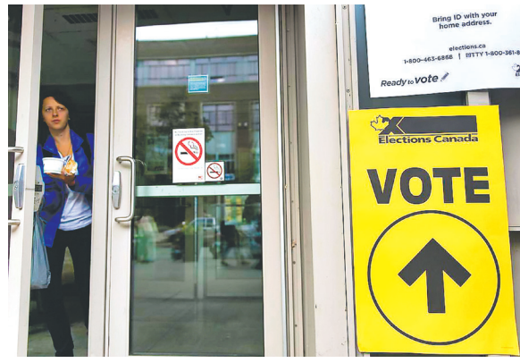
聯邦大選12月21日舉行，自由黨贏取少數政府。圖為國民前往投票。